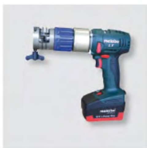
RPG ONE バッテリー型