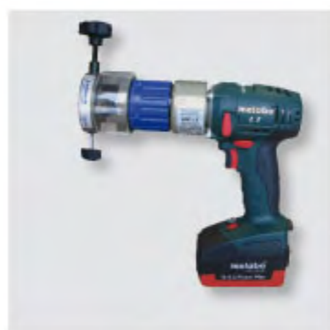
RPG 1.5 バッテリー型