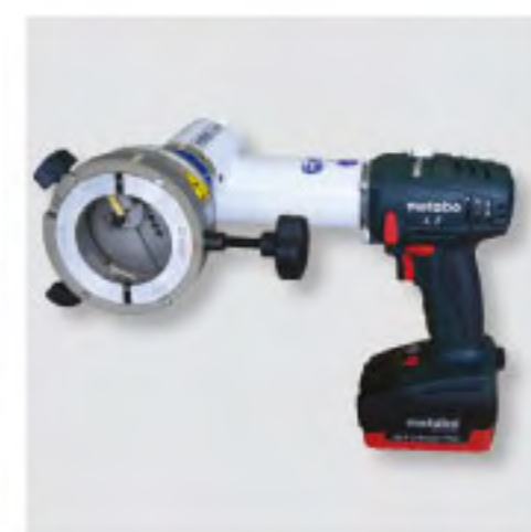
RPG 2.5 バッテリー型